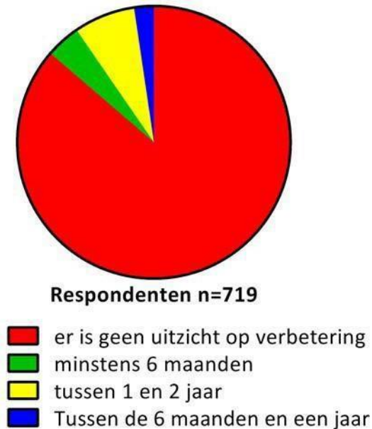
Figuur 4. Respons op de vraag hoe lang men verwacht dat de huidige situatie van structureel overwerken nog zal blijven bestaan. Percentages die geen verbetering verwachten, varieerden van 65% (promovendi) tot 84% (hoogleraren).